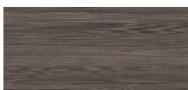
Décor FLEETWOOD BRUN