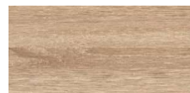
Décor SONOMA OAK (effet griffé)